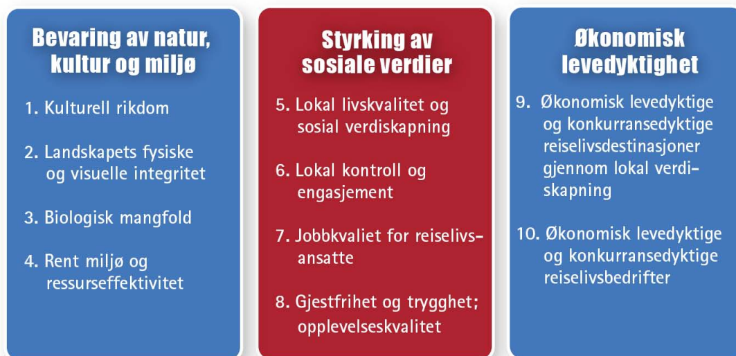
Figur 4.1. De tre bærekrafttemaene (Kilde UNWTO/Innovasjon Norge/NHO)

I bærekraftbegrepet er alle tre temaene likestilt. Det er altså like viktig for virksomheten å ta hensyn til samfunnet og økonomi som til miljøet.